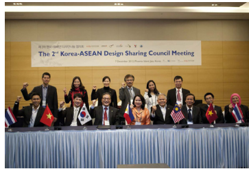
2012 제2회 아시아디자인나눔협의회