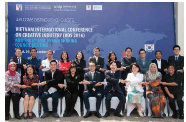
2016 제6회 아시아디자인나눔협의회