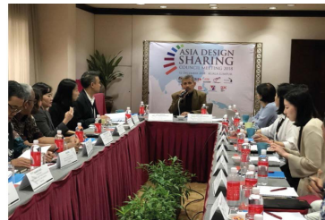
2018 제8회 아시아디자인나눔협의회