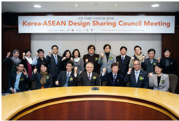
2011 제1회 아시아디자인나눔협의회