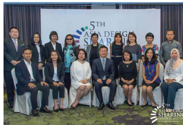
2015 제5회 아시아디자인나눔협의회