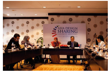
2013 제3회 아시아디자인나눔협의회