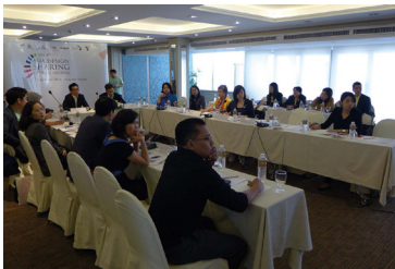
2014 제4회 아시아디자인나눔협의회