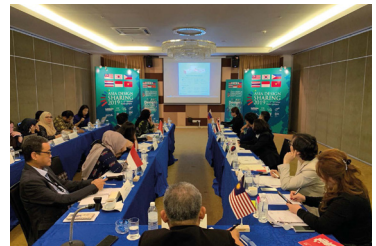
2019 제9회 아시아디자인나눔협의회